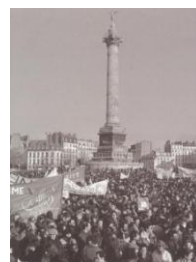
< Marche pour l'égalité ^

03/12/1996 Attentat dans le RER à Port Royal (Paris) - 4 décès- 170 blessés